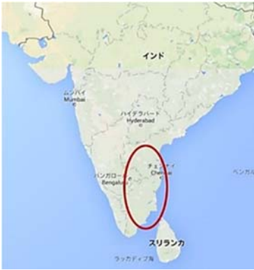
図1 インド・タミル地方